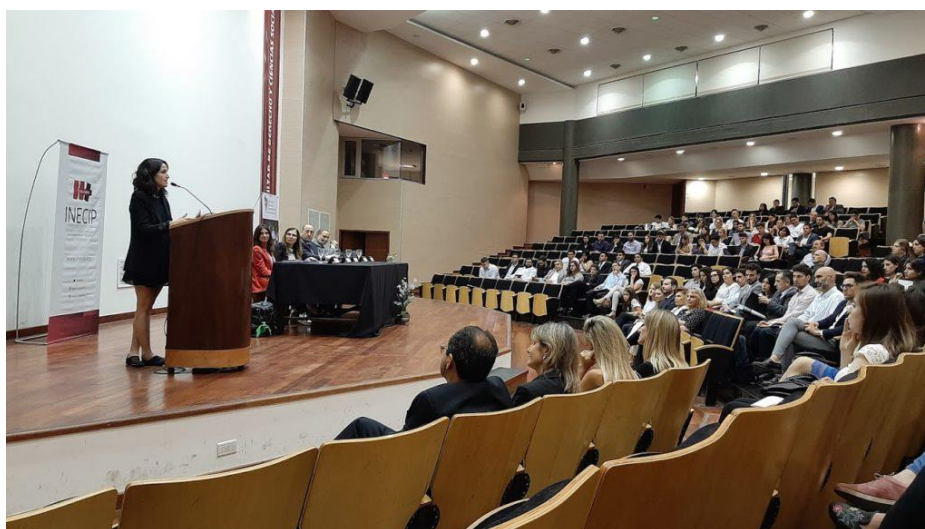
Acto de apertura del XI CNULP en la Universidad Nacional de Tucumán

docentes universitarios), 29 universidades (nacionales e internacionales), 18 docentes evaluadores de todo el país y más de 10 jueces, fiscales y defensores de Tucumán que hicieron las veces de jueces técnicos de los 63 simulacros de juicio desarrollados.